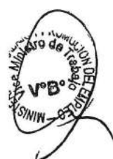
SYLVIA E. CÁCERES PIZARRO Ministra de Trabajo y Promoción del Empleo